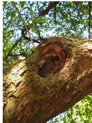
, 29 Juillet 2008