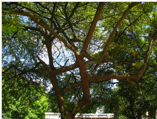
, 29 Juillet 2008