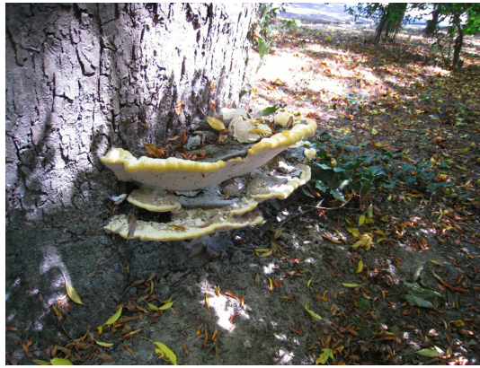
, 29 Juillet 2008