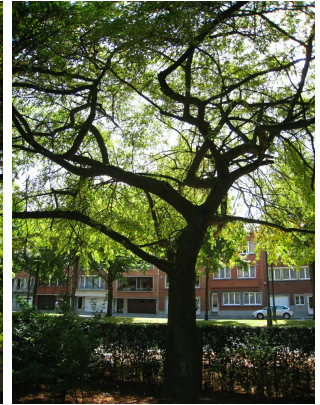
, 29 Juillet 2008