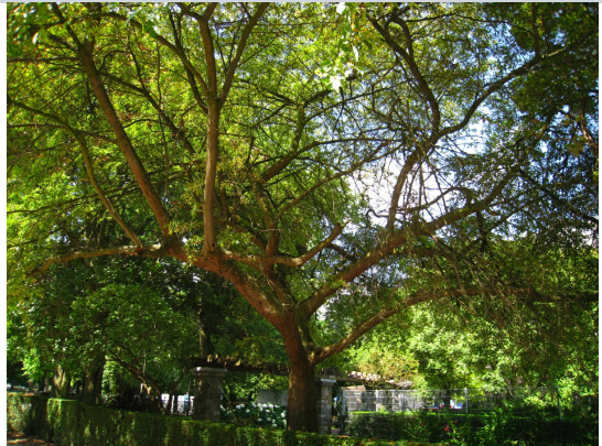
, 29 Juillet 2008