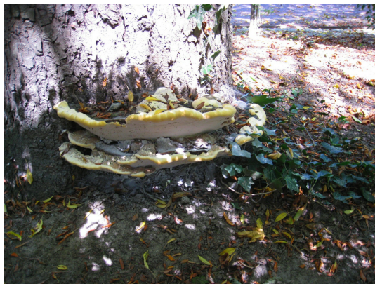
, 29 Juillet 2008