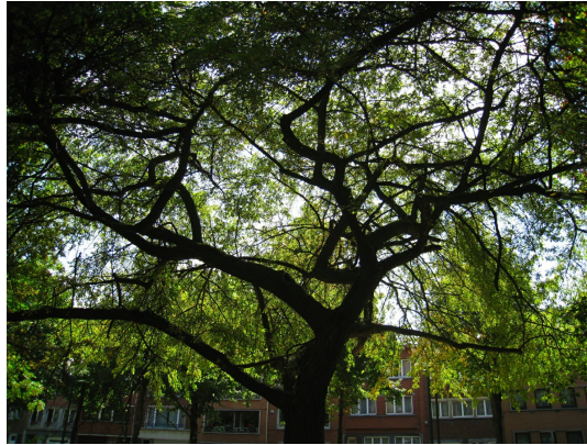
, 29 Juillet 2008