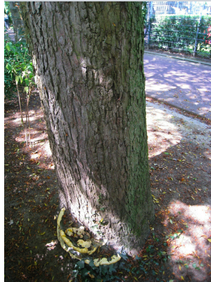
, 29 Juillet 2008

* Ces critères sont pondérés de la manière définie dans la méthodologie .